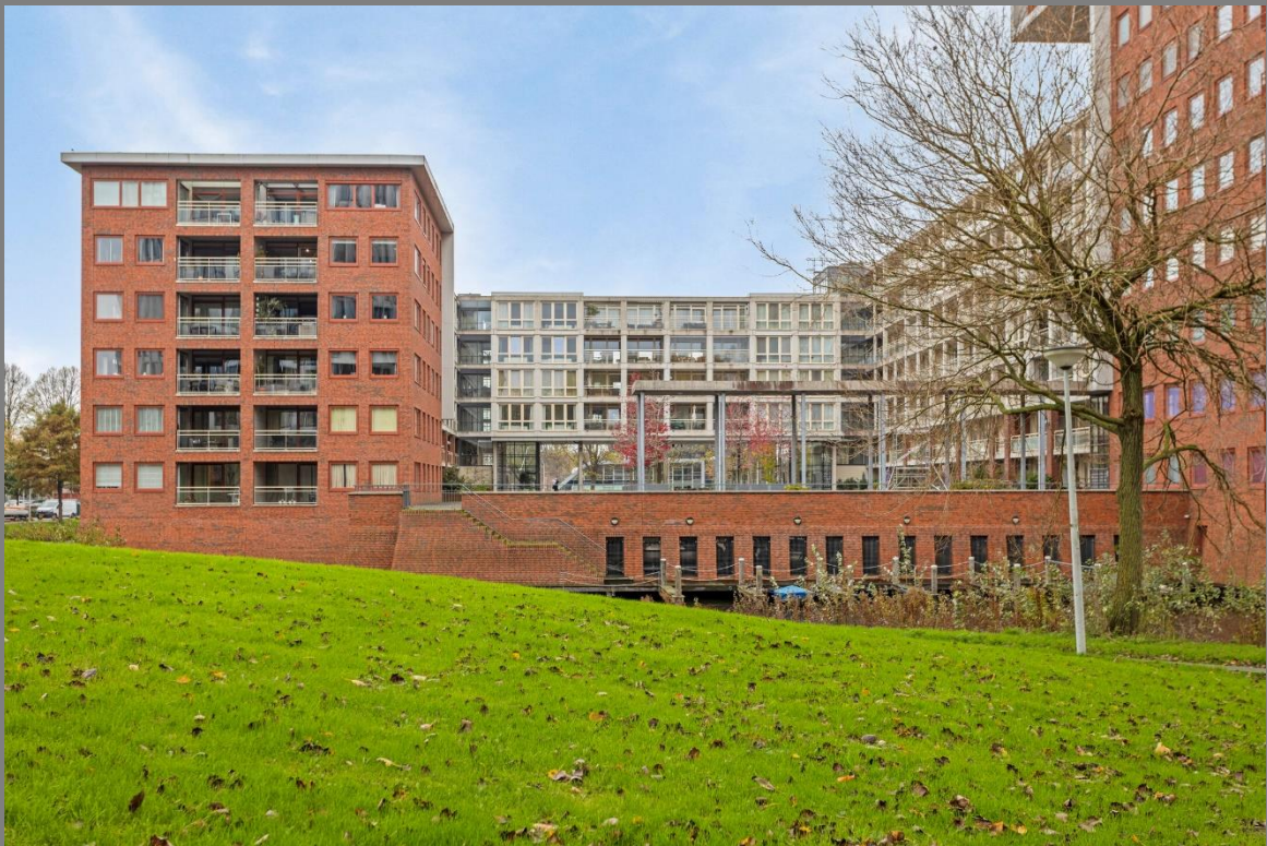
President Allendelaan 335