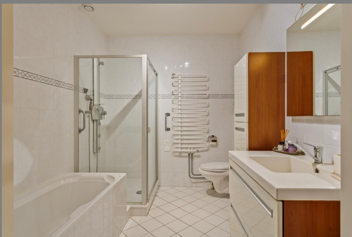
President Allendelaan 335