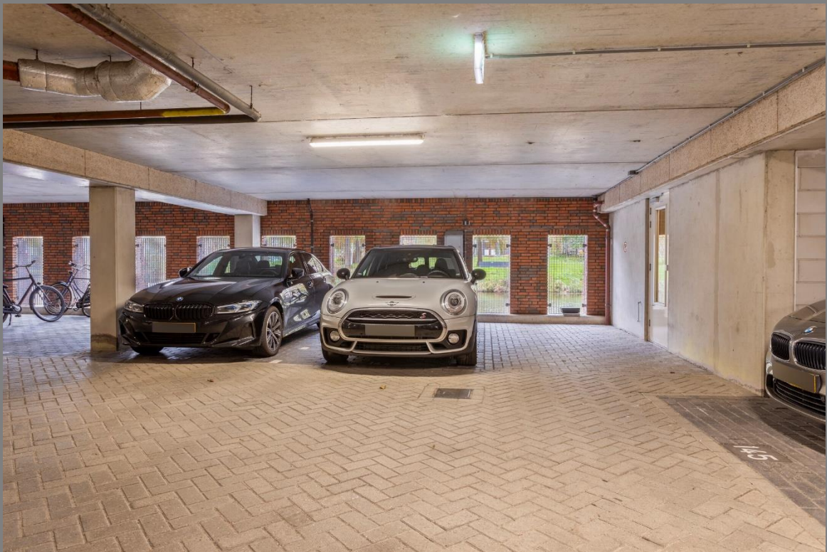
President Allendelaan 335