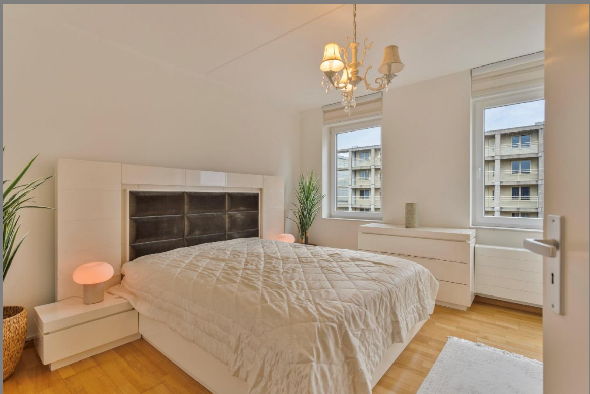
President Allendelaan 335