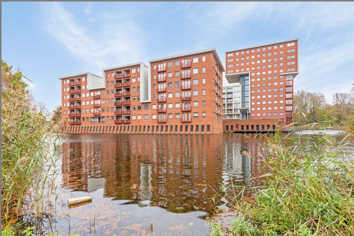
President Allendelaan 335