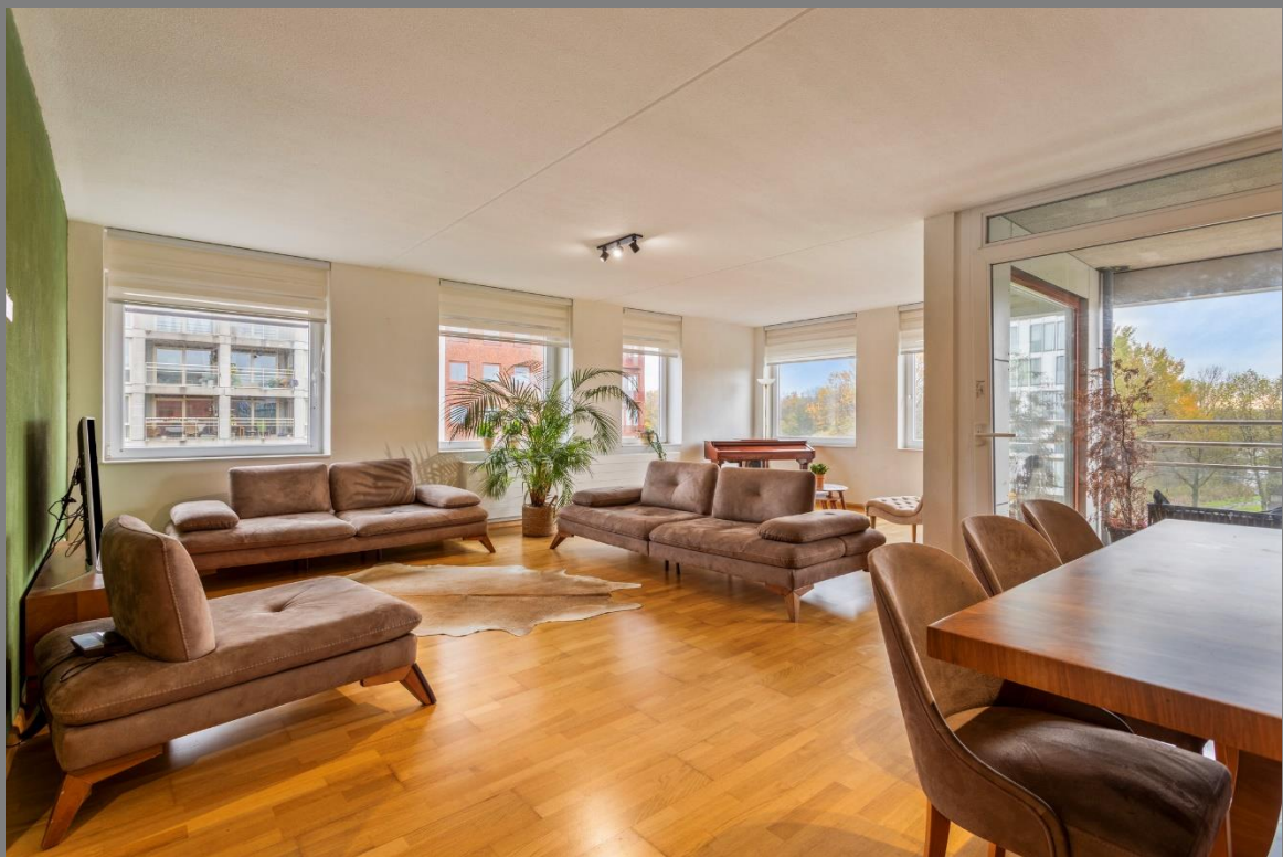
President Allendelaan 335