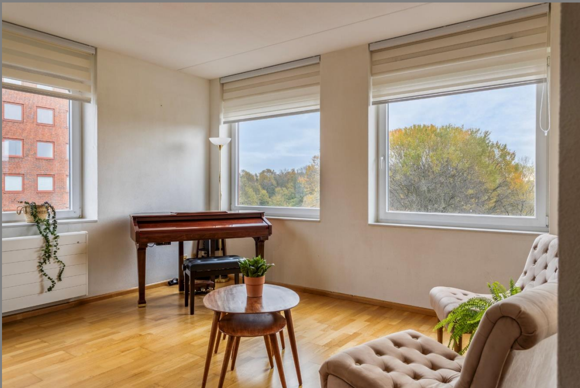
President Allendelaan 335