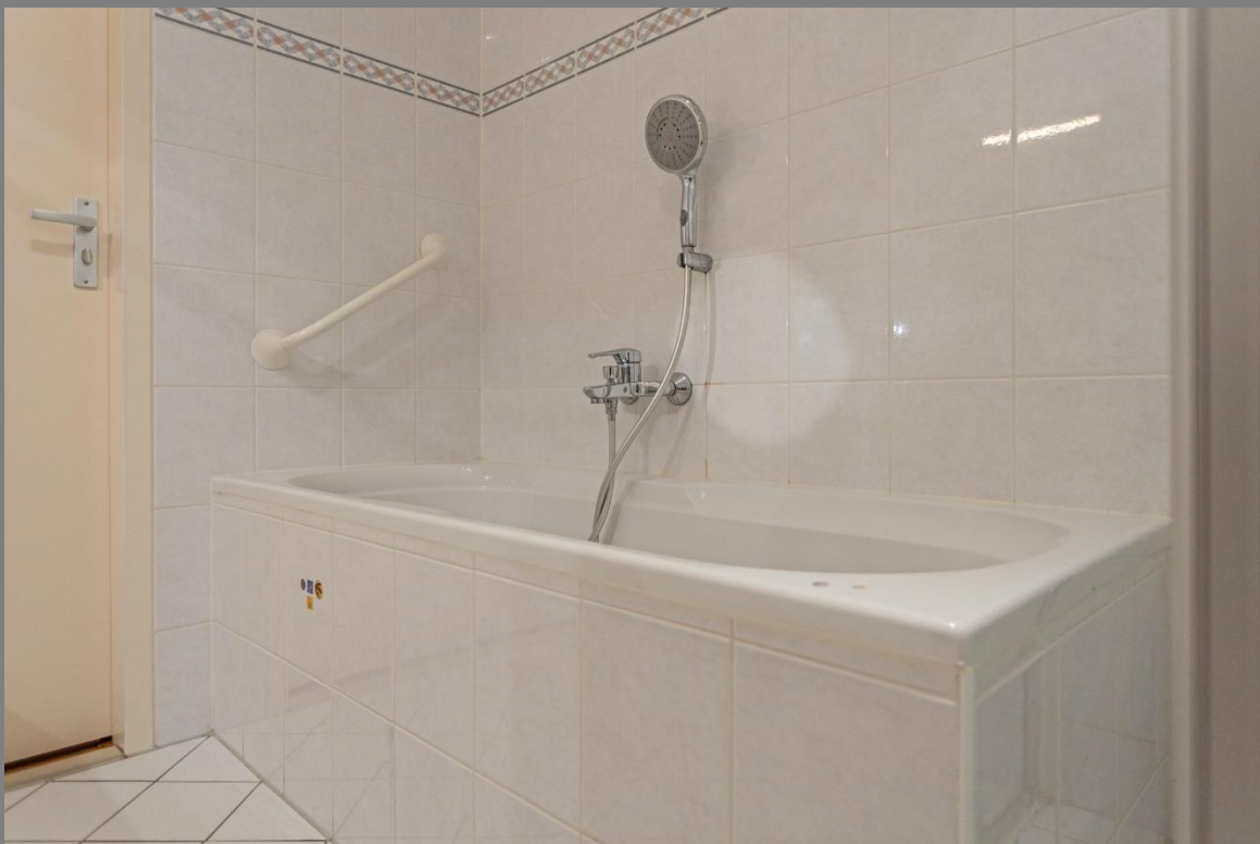
President Allendelaan 335