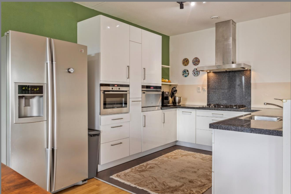
President Allendelaan 335